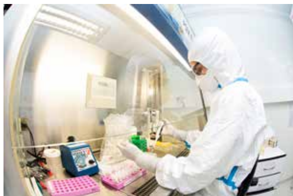
Institut Pasteur, Centre national des virus des infections respiratoires, avril 2020

Sans compter les 90 000 heures des rotariens en France, passées en bénévolat de toute forme, notamment en coaching d'entreprises et assistantat mobilisant les compétences professionnelles de nos membres.