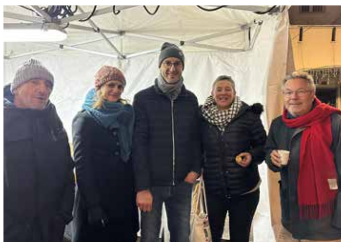
22 NOVEMBRE : L'Amicale des Commerçants et Artisans de la commune, en partenariat avec la mairie, proposait la traditionnelle soirée de dégustation du Beaujolais nouveau, place de l'Europe.