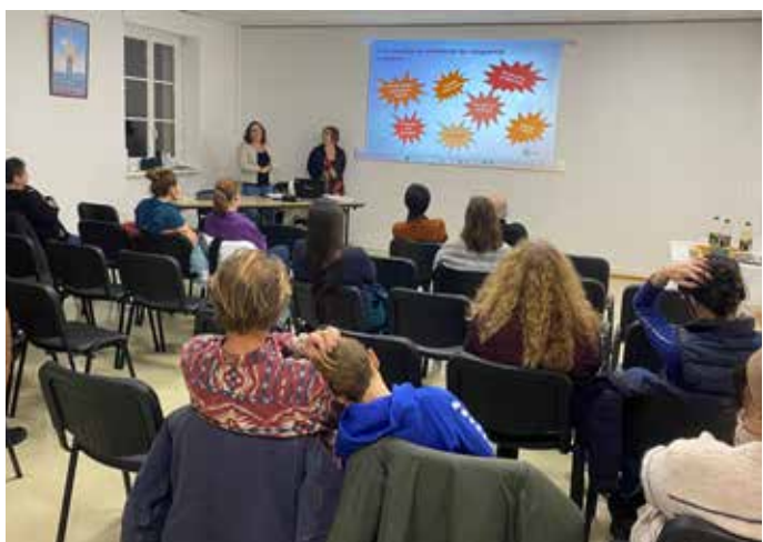
15 NOVEMBRE : Une quinzaine de parents ont répondu présent à la conférence organisée en mairie par le service Jeunesse sur le thème « Mon ado me provoque, comment réagir ? ».