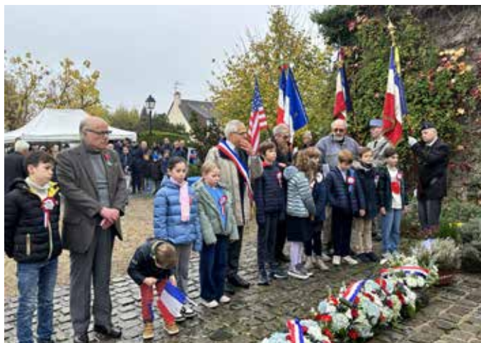
11 NOVEMBRE : Transmettre aux jeunes générations, le souvenir de l'Armistice de 1918 et du sacrifice des soldats morts pour la France, est chaque année l'un des objectifs de cette cérémonie solennelle.