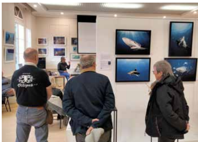
DU 17 AU 24 NOVEMBRE : La mairie et l'association Sharks Missions France , présentaient l'exposition « Arts et Océans » rassemblant les œuvres d'une vingtaine d'artistes, salle du conseil municipal.