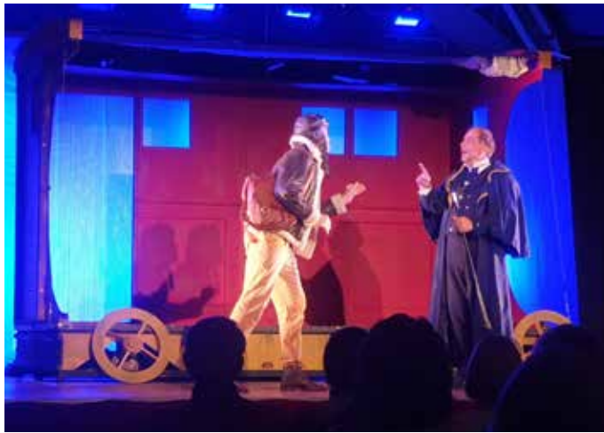
23 NOVEMBRE : Le service culturel de la commune a présenté une adaptation contemporaine de « L'École des Femmes », célèbre comédie de Molière, interprétée par la compagnie Viva à l'Espace JKM.