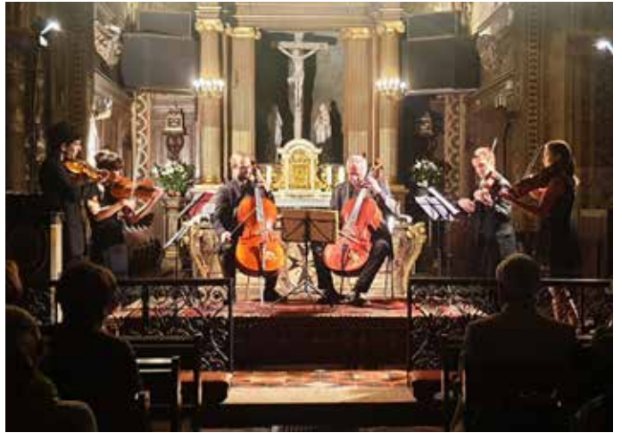
21 SEPTEMBRE : A l'occasion des journées du patrimoine, l'église a accueilli un concert de Musique de Chambre avec Bach, Fiorillo, Schubert et Rossini interprétés par l'ensemble de Musica .