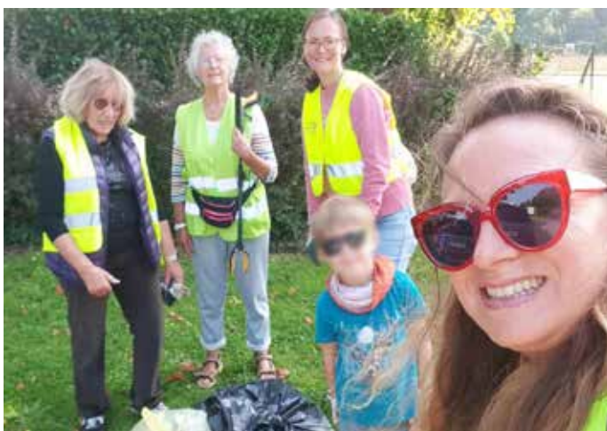
20 SEPTEMBRE : Dans le cadre du World clean up day , des habitants du village munis de gants et de chasubles fluo, s'étaient donnés rendez-vous, route de Villepreux, pour nettoyer les bords de route.