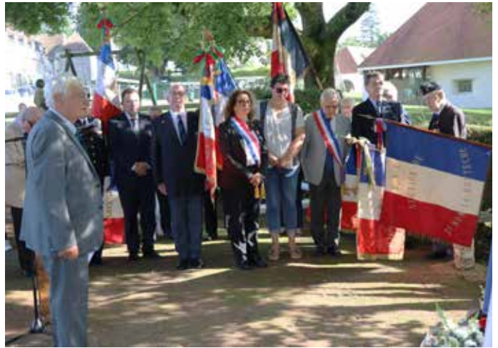
1er SEPTEMBRE : Comme chaque année, rendez-vous était donné à la stèle située à la Tuilerie-Bignon pour commémorer la mémoire des 3 ouvriers agricoles lâchement fusillés en 1944 par l'occupant.