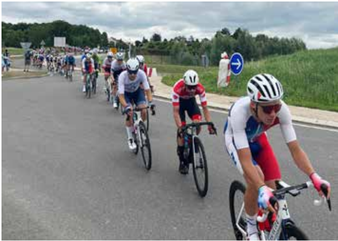
3 AOÛT : Vers midi puis 14h, les athlètes qui participaient à la course cycliste en ligne masculine sont passés par Saint-Nom-la-Bretèche, épreuve olympique diffusée dans le monde entier.