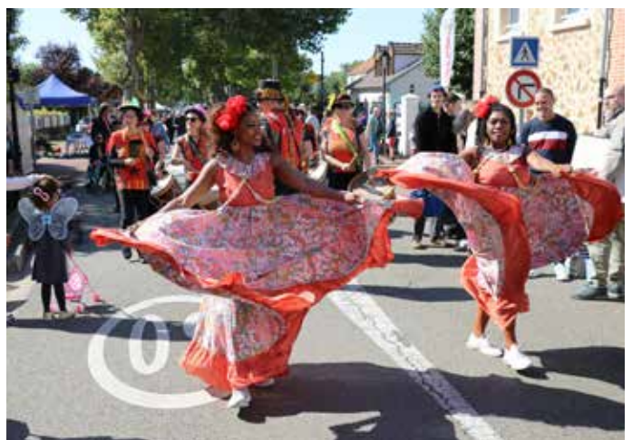
15 SEPTEMBRE : Les 150 exposants inscrits à la brocante et les nombreux chineurs ont bénéficié d'une très belle météo et d'une animation batucada colorée originaire du Brésil.