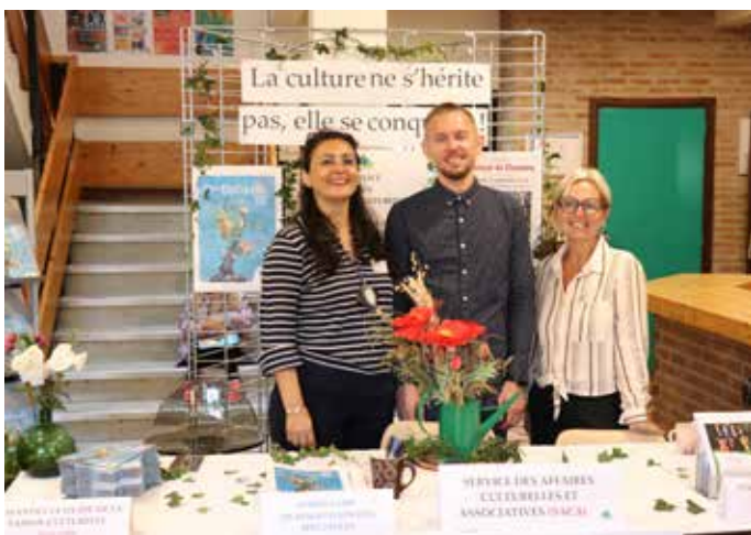
7 SEPTEMBRE : Inscriptions, adhésions, renseignements étaient au coeur de la journée des associations organisée par l'équipe du SACA, l'occasion pour elle de présenter la nouvelle saison culturelle.