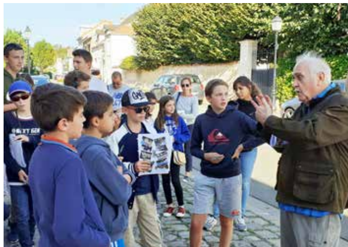
17 ET 18 SEPTEMBRE : L'association des Amis de Saint-Nom , spécialisée dans les recherches historiques proposait un circuit découverte de notre village à l'occasion des Journées du Patrimoine.