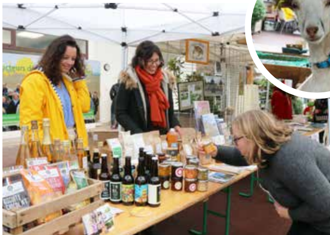
17 SEPTEMBRE : Organisée par l'association Saint-Nom La Nature en partenariat avec la mairie, la Fête des plantes et de l'environnement a eu lieu, place de l'Europe, avec une mini ferme pédagogique locale.