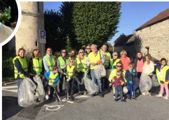
17 SEPTEMBRE : Une opération de nettoyage citoyen a été proposée par un habitant de la commune dans le cadre international du World Cleanup Day , initiative soutenue par la mairie.