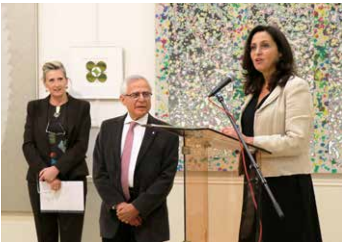
29 SEPTEMBRE : Vernissage de l'exposition « hors les murs » de la galerie Bessières art contemporain , présentée en mairie jusqu'au 9 octobre 2022.