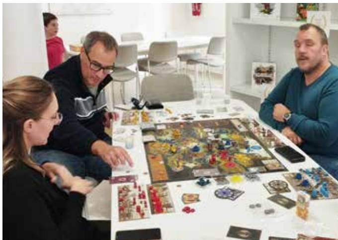
1er OCTOBRE : Journée d'inauguration de la ludothèque municipale « Jouons à Saint-Nom » située rue Michel Pérot, ouverte désormais tous les mercredis et environ deux samedis après-midi par mois.