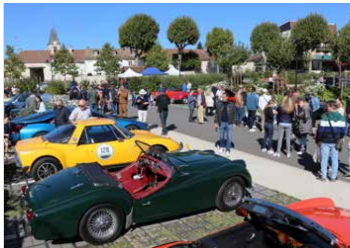
25 SEPTEMBRE : Une trentaine de véhicules de collection et de prestige a participé au rallye touristique Saint-Nom Classic et s'est rassemblée, parking des Platanes, pour le plus grand plaisir du public.